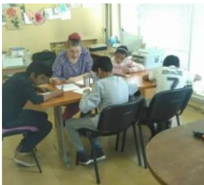
Intensieve opleiding Engels

In 2015 heeft Help Tabitha weer een bedrag van € 14.500,- als ondersteuning aan Tabitha Bulgaria kunnen overmaken. Het procentuele deel dat Help Tabitha van de totale exploitatiekosten van Tabitha Bulgaria voor haar rekening neemt blijft hiermee onder het niveau wat Tabitha Bulgaria per jaar nodig heeft. Tabitha Bulgaria slaagt er tot nu toe in om via andere sponsors de begroting rond te krijgen, dit zal in de toekomst moeilijker worden.