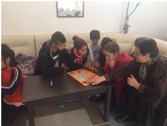
Roman Ouderen centrum, Project "Bridge between generations"

De ondersteuning aan Tabitha Bulgarije wordt per kwartaal vooraf beschikbaar gesteld. De structurele bestemde reserve waarborgt voor enkele maanden voortzetting van de ondersteuning. De bestemde reserve is per eind 2018 ongewijzigd, € 6.280,00.