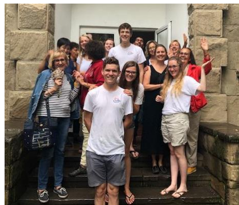
Groep uit Putten met verslaggeefster regionale TVzender