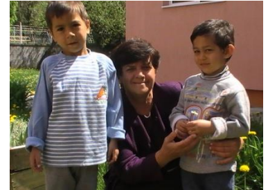
Een van de 28 baba's met 2 van 'haar' kinderen

Daarbij worden eisen aangesteld (meerjarenplan, goede verslaglegging e.d.). Help Tabitha heeft deze status gekregen en staat als zodanig in de registers ingeschreven onder nummer RSIN 8089589877.