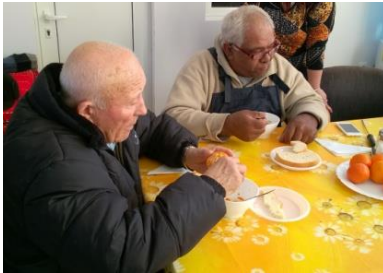
Mannen en vrouwen genieten van de 'soupkitchen' in het Ouderen centrum in Roman

In het verleden werd de ondersteuning aan Tabitha Bulgaria in de administratie opgenomen als een post voor organisatiekosten tbv Tabitha Bulgaria. Met de financiële ondersteuning door Tabitha Nederland was men in Bulgarije in staat de hulpprojecten te organiseren en kon daarnaast acquisitie gedaan worden voor fondsenwerving voor de projecten. In Bulgarije had men "de hengel, om vis te vangen in plaats van dat wij vis geven". Daarom wordt al een paar jaar de ondersteuning van Tabitha Bulgarije in een apart project verwoord. Hiermee wordt ook duidelijker welk geld beschikbaar is voor projecten en welk geld aangewend wordt voor organisatie kosten Tabitha Bulgaria.