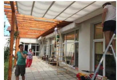
De groep uit Bruchem bracht een zonwering aan over het terras in Vratsa. Huis voor kinderen met meervoudige beperking

*) tevens vicepresident van Tabitha Bulgaria