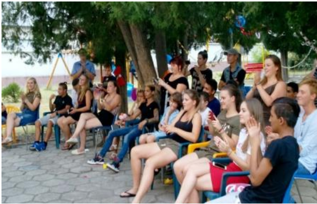
De groep van Wijk & Aalborg kwam dit jaar voor de 10e keer naar Stara Zagora