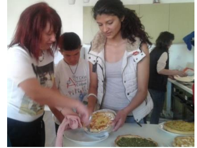
Kookles in Samokov (small group house)

In Bulgarije loopt het proces om de weeshuizen te sluiten nog steeds. Hiervoor in de plaats komen dan met geld van de EU zogenaamde "Small group houses". Bij de opzet van de Small group houses zien we dat de overheid kort op de budgetten van de tehuizen. Dit zorgt voor extra aanvragen bij Tabitha Bulgaria voor opleidingsprojecten en specialistische ondersteuning, zoals psychotherapie en logopedie.