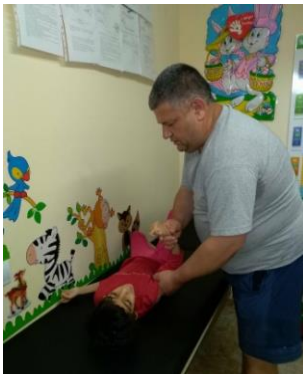
Deze fysiotherapeut in Vratsa en Mezdra zingt zachtjes tijdens zijn werk. Dit maakt de kinderen rustig en vertrouwd.

Op deze manier hopen we de financiële ondersteuning, die SKB aan Bulgaarse projecten in de afgelopen jaren gaf, te waarborgen voor de komende jaren. SKB blijft een aparte stichting.