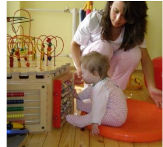
Fysiotherapie in Vratsa