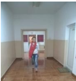
Over de terrazzo vloer in Roman werd een tegelvloer gelegd