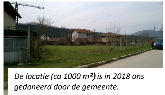
De locatie (ca 1000 m 2 ) is in 2018 ons gedoneerd door de gemeente.

Daarnaast zal het project Weeshuis Roman en Ouderen Centrum Roman onze aandacht blijven houden. Voor het weeshuis richten we ons op het isoleren van het tehuis en voor de kinderen richten we ons meer op onderwijsondersteuning en het baba-project. Voor de ouderen zijn we in gesprek met de gemeente over de aankoop van een stuk grond om daar een aantal mobiele woningen voor de ouderen te realiseren.